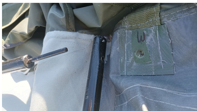
7. Przed przełożeniem

2. Kalenicę składającą się z dwóch rurek łączymy ze sobą i kładziemy na listwę kaleniczną namiotu zgodnie z otworami.