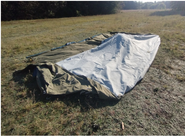
9 3 osoby przekładają namiot na pól