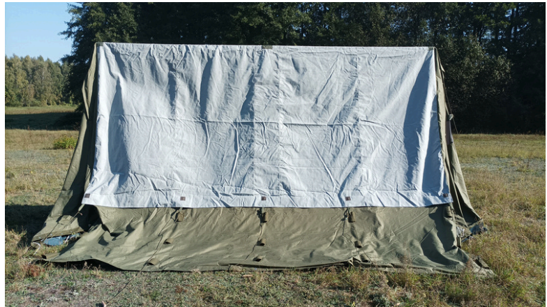
10.Podnosimy na komendę