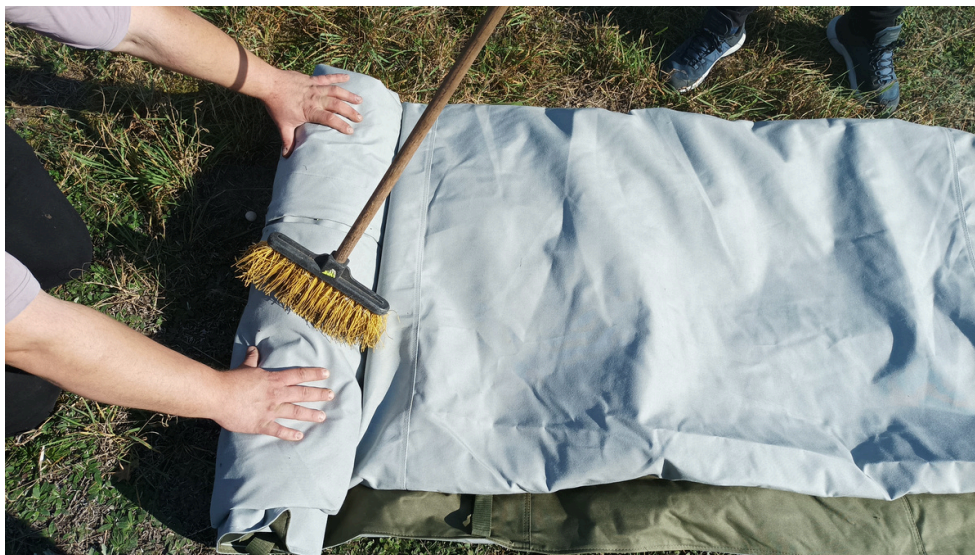
Przykład czyszczenia namiotu w trakcie zwijania