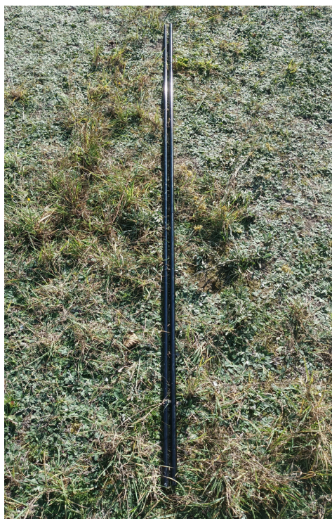
4. Rurki do kalenicy