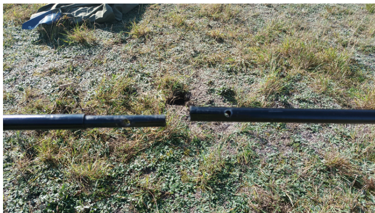
5. Łączymy rurki zgodnie z otworami