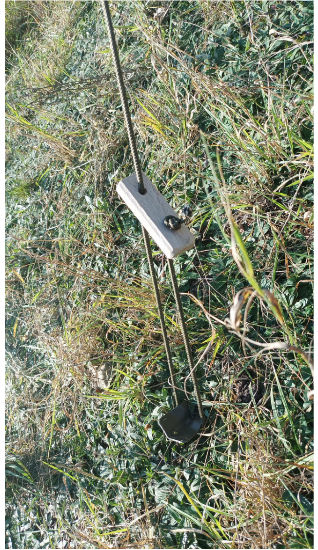
13.Naciąganie i wbijanie śledzi

5. Do tak postawionej czaszy namiotowej czwarta osoba w przelotki w burtach wkłada zapalki i naciąga linki na śledzie wbite w ziemię pod kątem 45 stopni zaczynając od narożnych .Osoba trzymająca środkowy maszt puszcza go i pomaga przy czynnościach napinania namiotu . tak aby dach namiotu był dobrze naciągnięty dla odpowiedniego odpływu wody opadowej