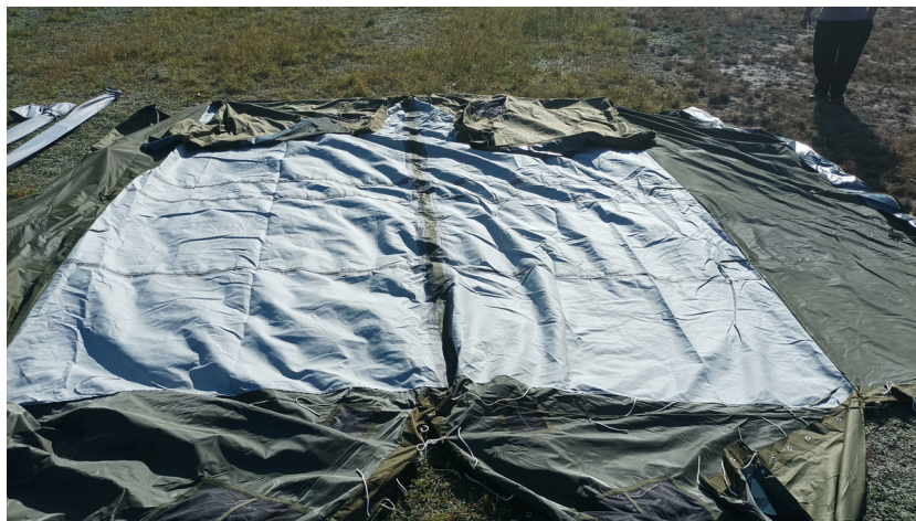
3. Namiot po rozłożeniu

1. Wszystkie elementy namiotu wyjąć z worków transportowych . Czasze namiotową rozkładamy w całości na przygotowanym wcześniej miejscu stroną wewnętrzną do góry , w tym czasie zakładamy odciąg do pasków , które znajdują się przy otworach do umieszczenia zapalek.