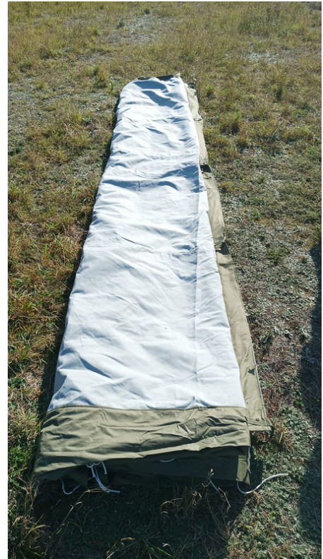
2. Odwijamy namiot