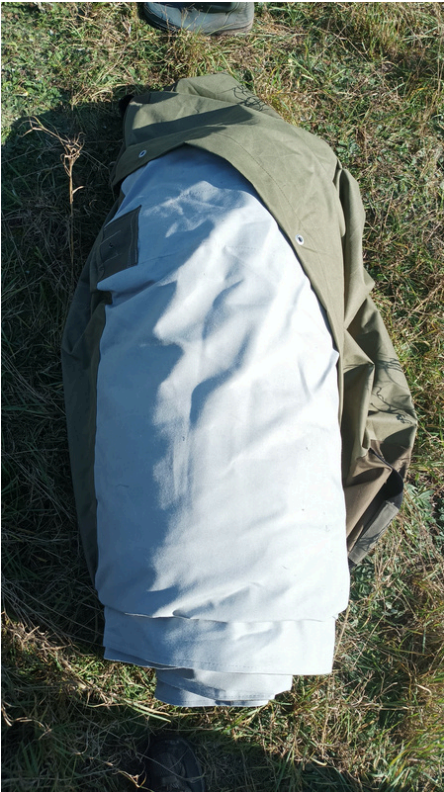
1. Wyjmowanie czaszy z worka

Podłoże do rozstawienia namiotu powinno być równe, bez zbędnych gałęzi, szyszek i pieńków . Do rozłożenia namiotu potrzebne są minimum 4 osoby .