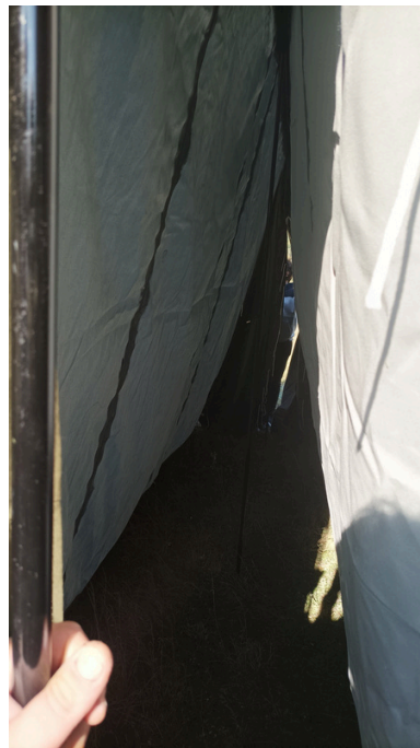
11.Wnętrze rozkładanego namiotu

4. Czaszę namiotu składamy na pól –tak aby maszty i kalenica były wewnątrz. 3 osoby na komendę trzymając maszty unoszą namiot na masztach do góry.