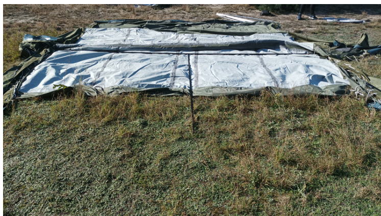
6. zakładamy na namiot

2. Kalenicę składającą się z dwóch rurek łączymy ze sobą i kładziemy na listwę kaleniczną namiotu zgodnie z otworami.