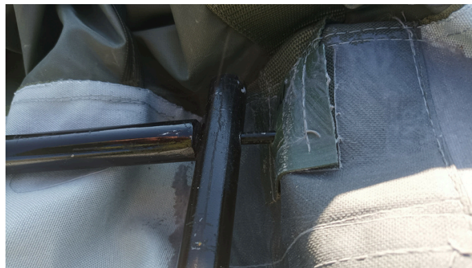
8. Po przełożeniu

3. Maszty zakończone bolcem wkładamy w otwory kalenicy i listwy kaleniczej.